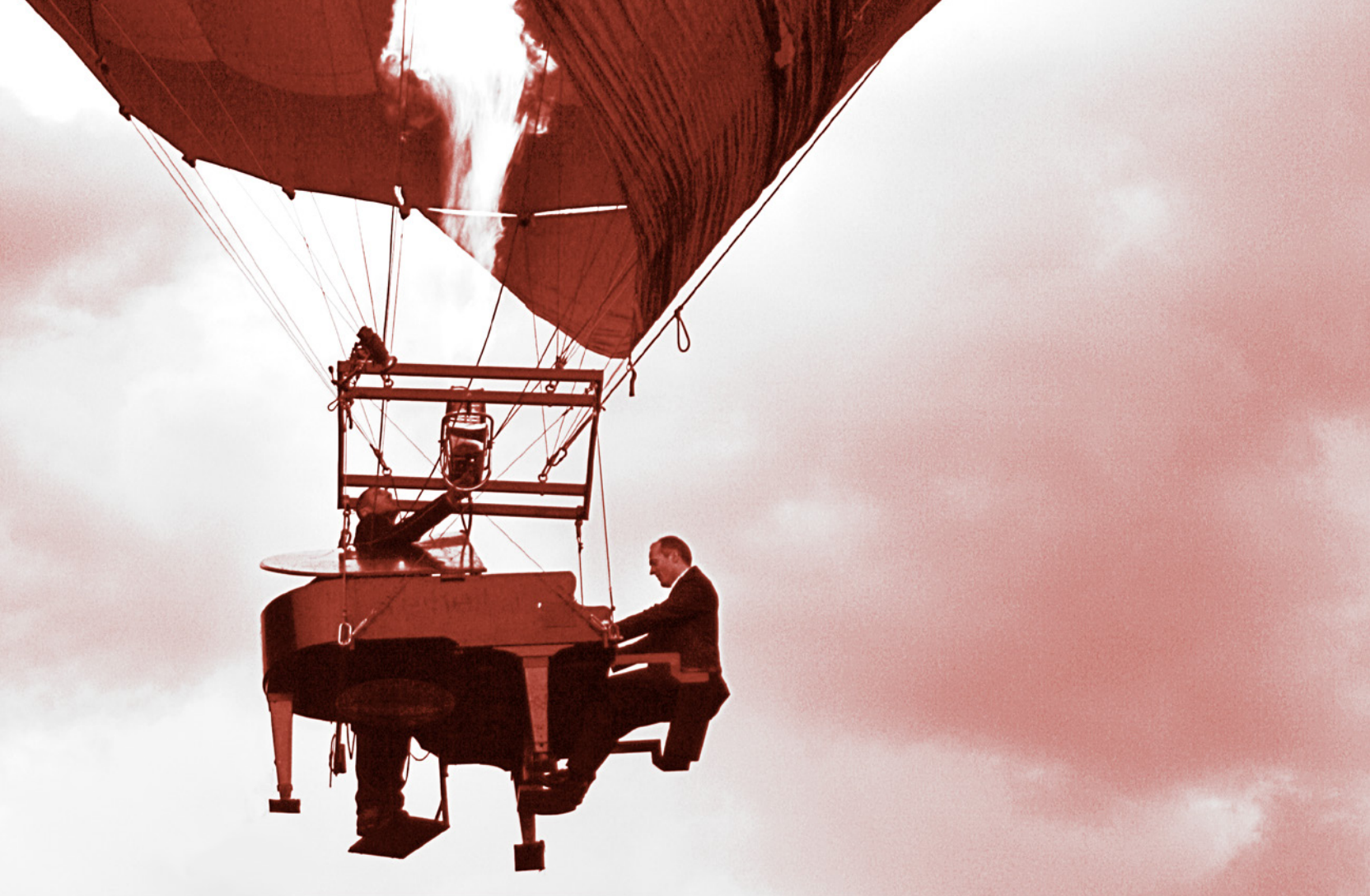
Waghalsiges Experiment: Im Höhenflug den richtigen Ton treffen oder Bruchlandung mit zerstörter Klaviatur?