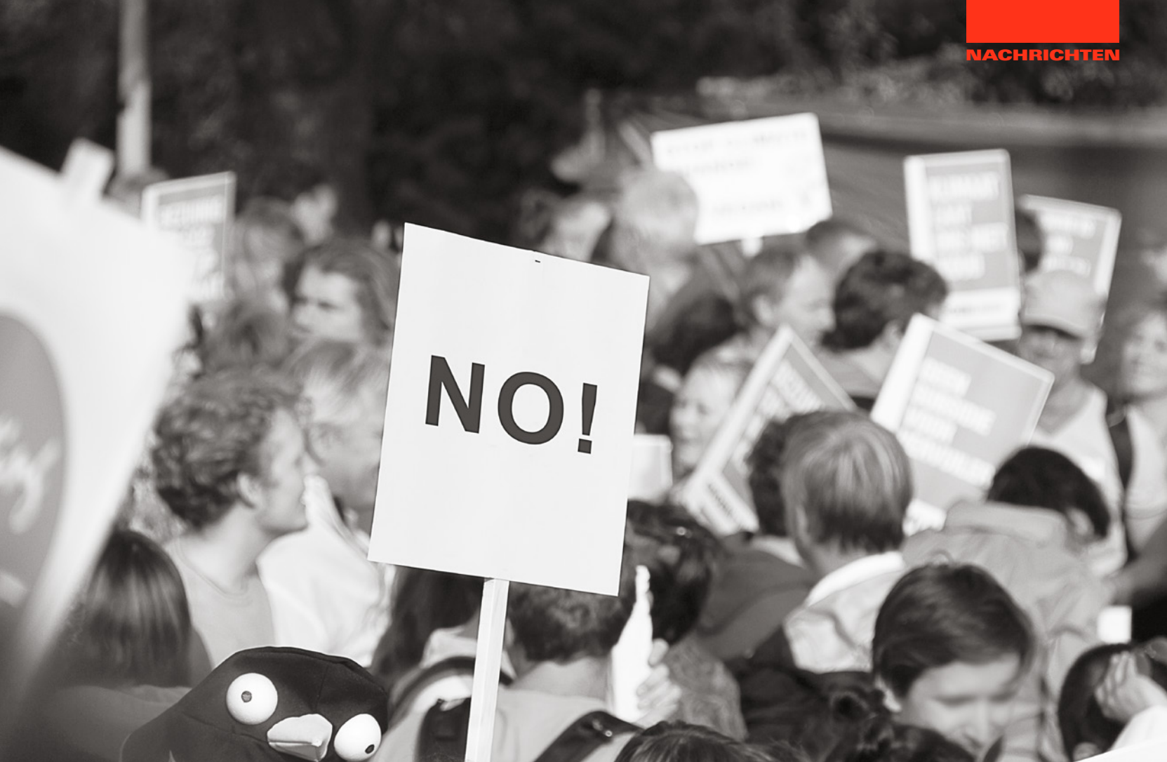
Bei einem «Nein!» allein darf es nicht bleiben, wenn eine gesellschaftliche Transformation gelingen soll.