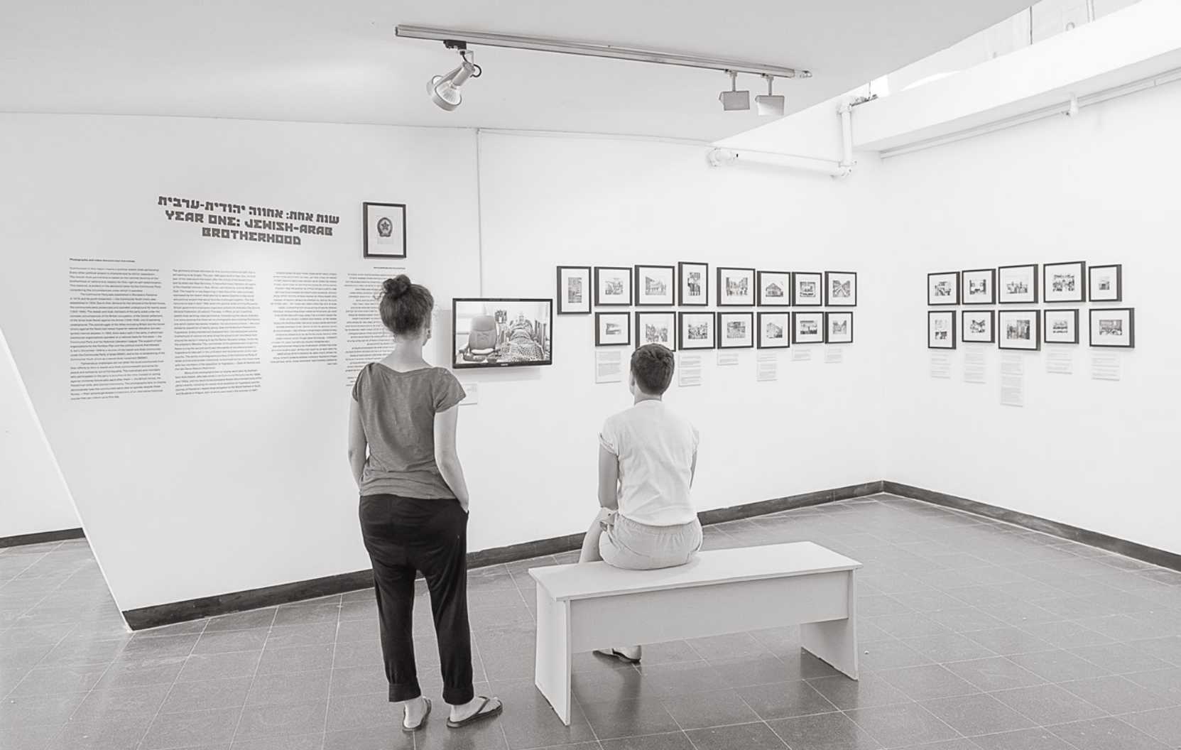
Besucherinnen der Ausstellung «The Kids want Communism» in den kommunalen Museen von Bat Yam (MoBY) nahe Tel Aviv.