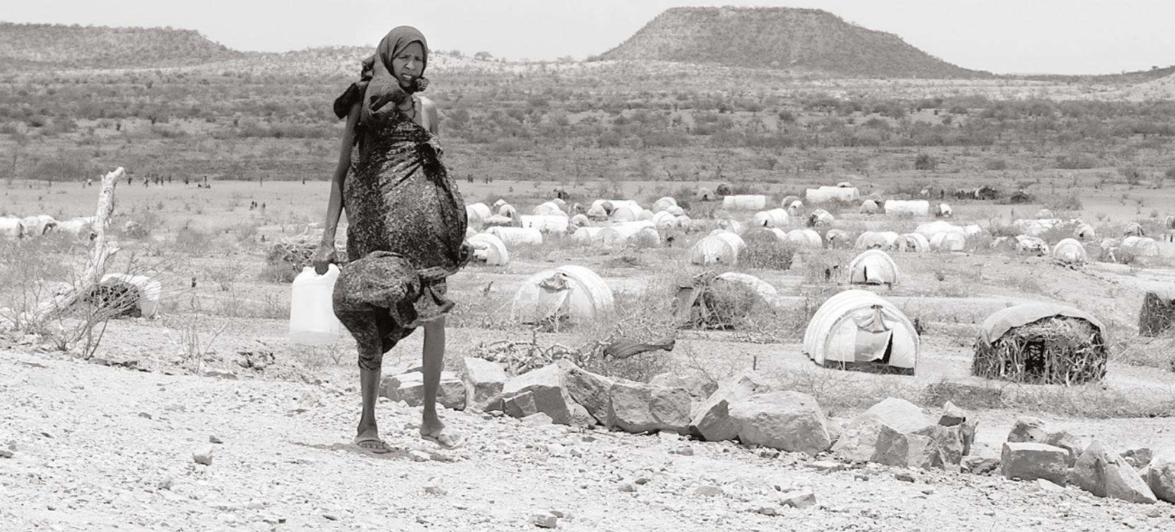
Tausende SomalierInnen leben – Dürre und Hungersnot entflohen – in Flüchtlingslagern entlang der äthiopischen Grenze.

Flussdeltas wie das Nildelta und das Moulouya-Delta in Marokko versalzen, weil Meerwasser in die Flussmündungen drückt. Langfristig könnte dies die Landwirtschaft unmöglich machen.