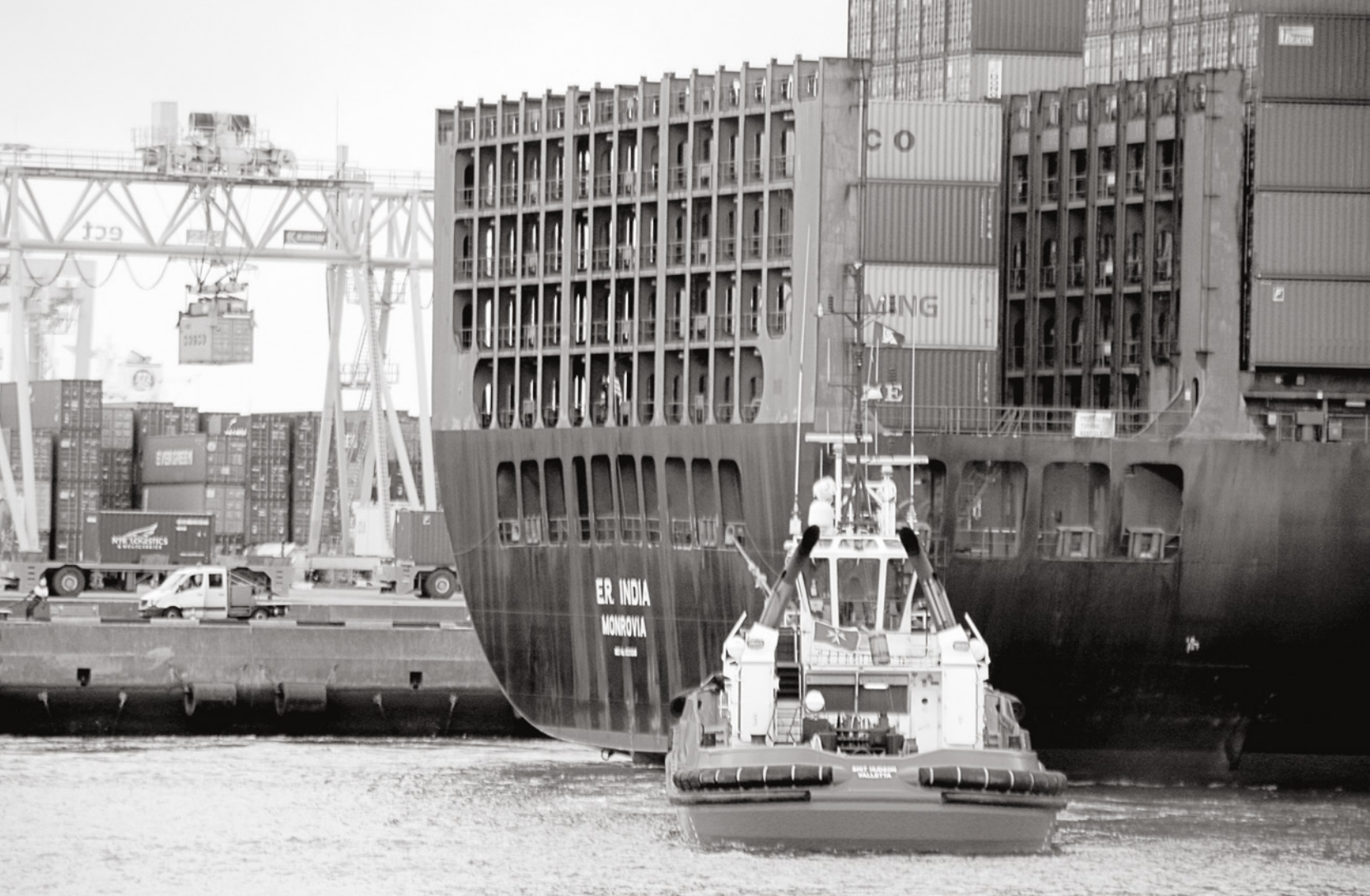
Das Ausflaggen von Containerschiffen perfektioniert Lohndumping und prekäre Arbeitsverhältnisse in der globalen Lieferkette.

und dem gigantischen Gelände des Rotterdamer Hafens finden sich hingegen weder Restaurants oder Bars noch Einkaufsmöglichkeiten. In Rotterdam verlassen die häufig aus Südostasien stammenden Besatzungen aufgrund der EU-Einreisebestimmungen auch während der Ladearbeiten nicht die Containerriesen. Händler und Ärzte kommen zu ihnen, um sie mit dem Nötigsten für die monatelangen Aufenthalte auf See zu versorgen.