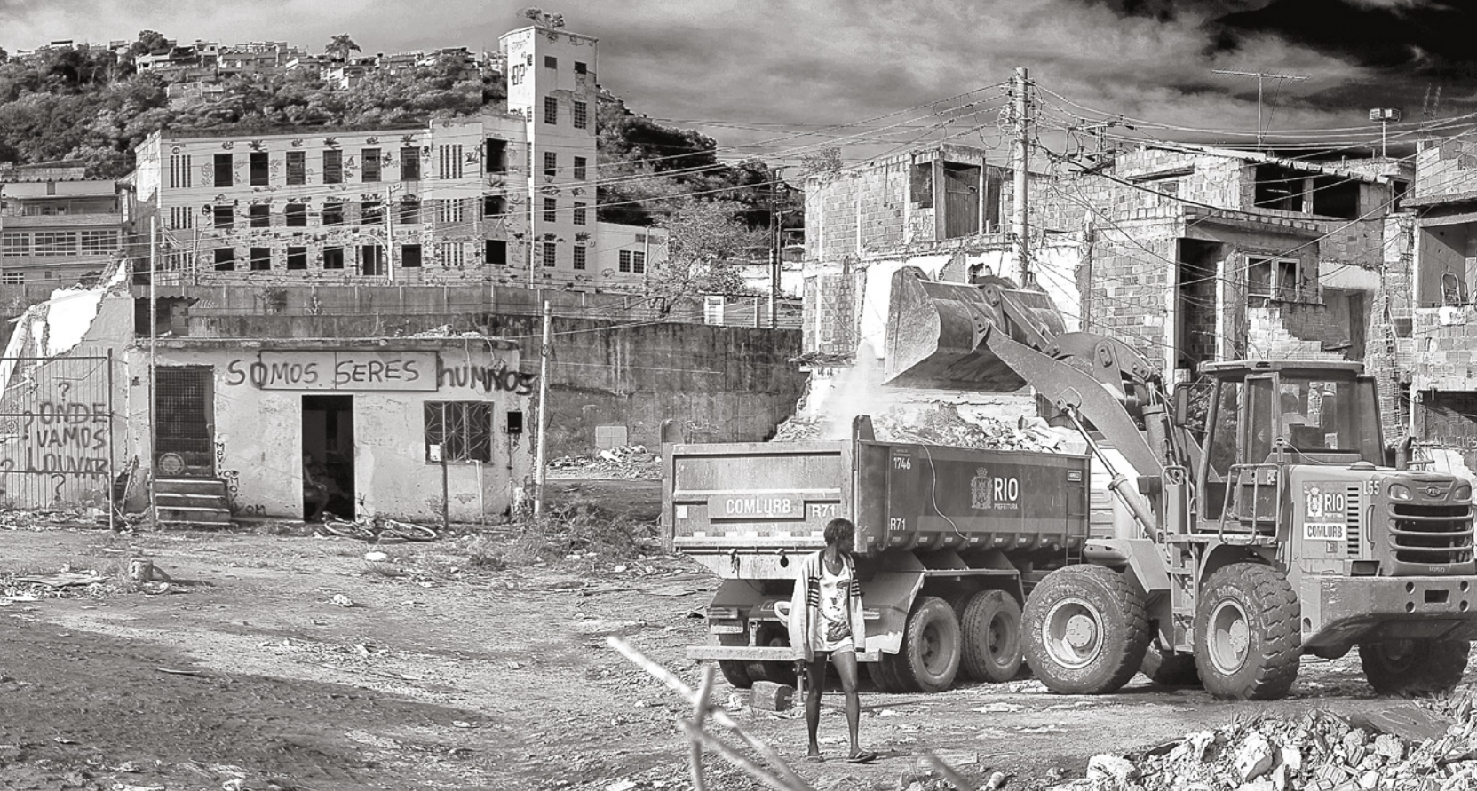
Die verwüstete Favela Metrô-Mangureira in der Umgebung des Maracanã-Stadions, wo die Olympischen Spiele 2016 eröffnet wurden.