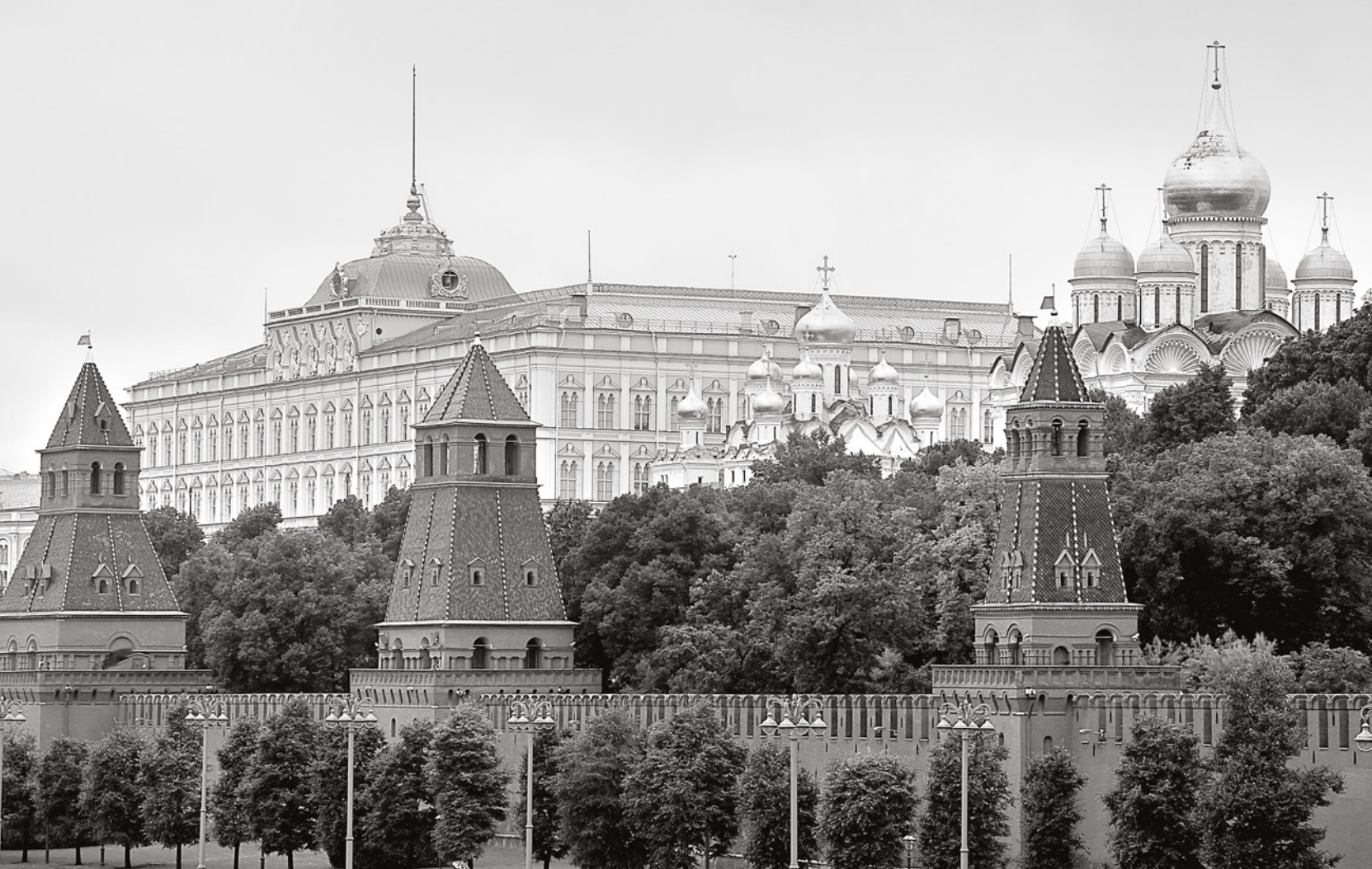
Machtzentrum der Russländischen Föderation: Der Moskauer Kreml. Den jüngsten Wahlen blieben viele WählerInnen fern.

auf 42 Sitze, darunter sieben Direktmandate. Die Liberal-Demokratische Partei Russlands unter dem National-Populisten Shirinowski legte auf 13,1 Prozent leicht zu, bekam 39 Sitze, fünf davon direkt. Die sozialdemokratisch ausgerichtete Partei «Gerechtes Russland» unter Mironow verlor sieben Prozent, sie kam auf 6,2 Prozent und 23 Mandate, davon sieben direkt. Nur auf jeweils ein Direktmandat kamen «Heimat», die Bürgerplattform sowie ein angeblich Unabhängiger. Die Wahlbeteiligung lag laut Wahlkommission bei 47,88 Prozent. So niedrig wie noch nie. 2011 lag sie bei 60,12 Prozent. Bei keiner nach-sowjetischen Wahl kam man jedoch über 65 Prozent.