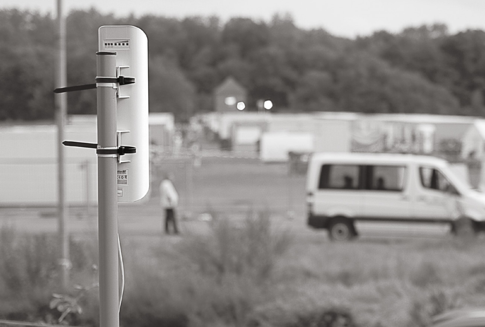
Ein Freifunk-Router schickt WLAN von einer Garage zu einer Erstaufnahmeeinrichtung auf dem Volksfestplatz in Lübeck.