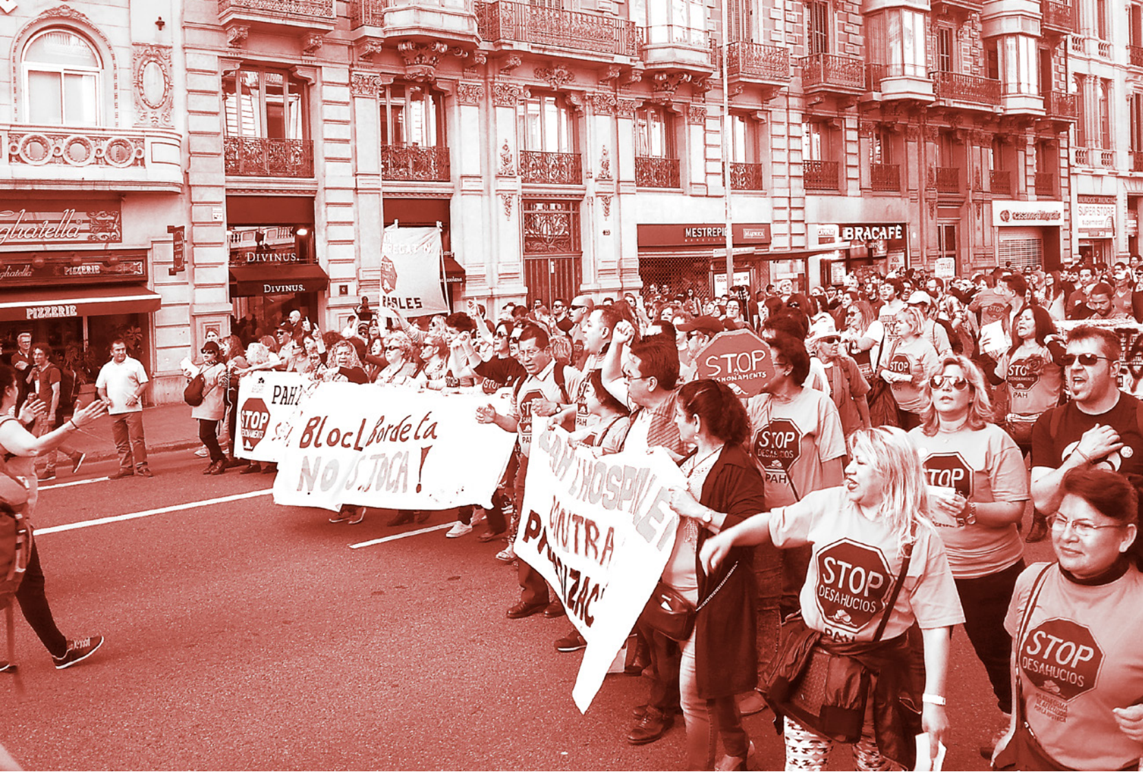
Vereint auf der Straße: Zum fünften Jahrestag der Bewegung «15. Mai» demonstrieren SympathisantInnen in Barcelona.