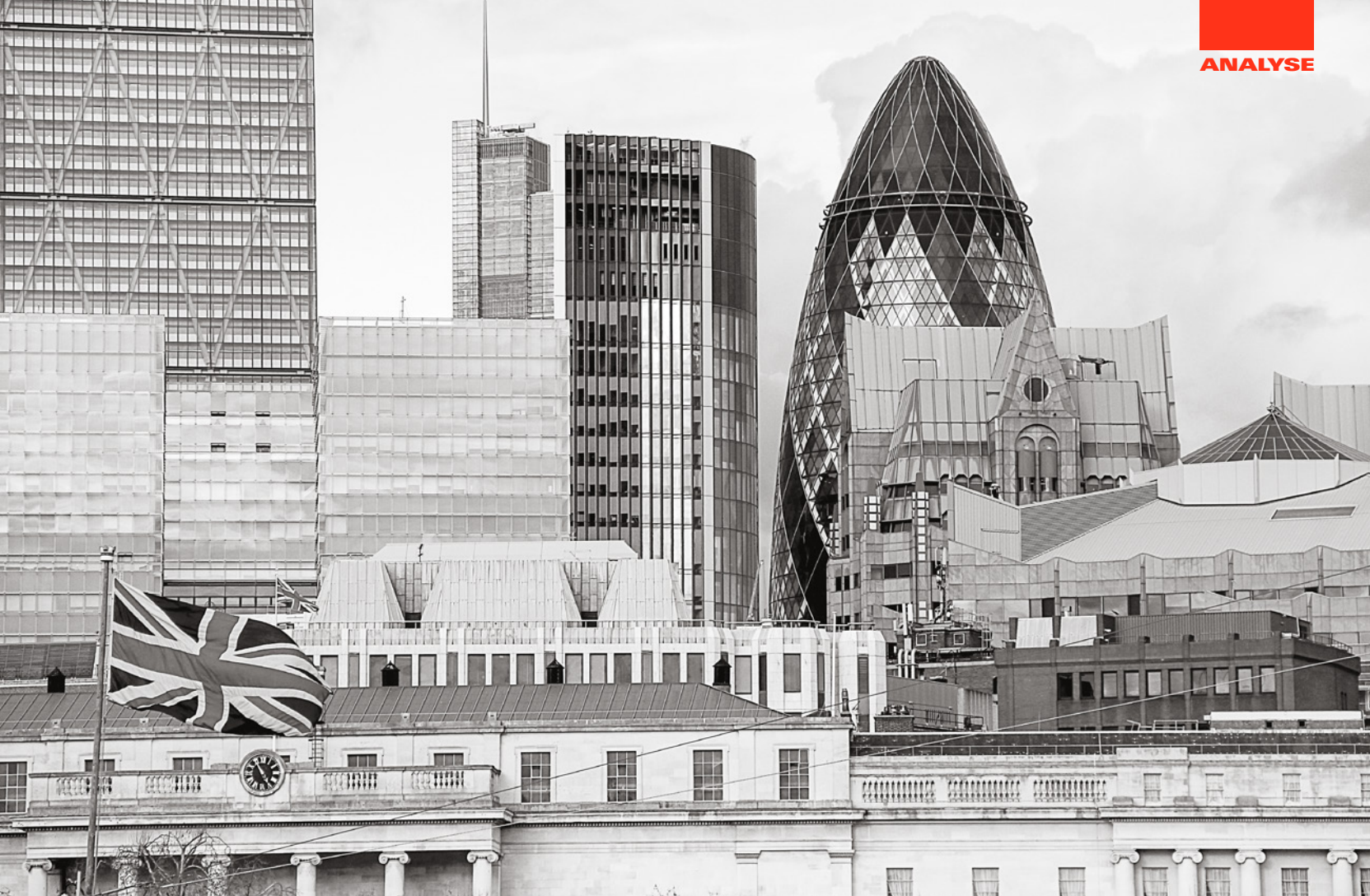
Silhouette einer durchkapitalisierten, neoliberalen Gesellschaft – das Finanzzentrum der britischen Hauptstadt London.