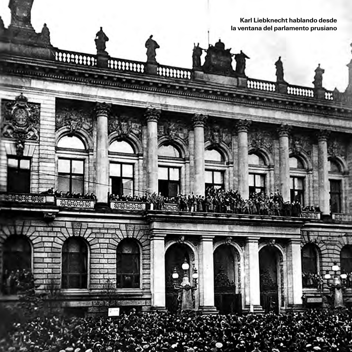
Karl Liebknecht hablando desde la ventana del parlamento prusiano