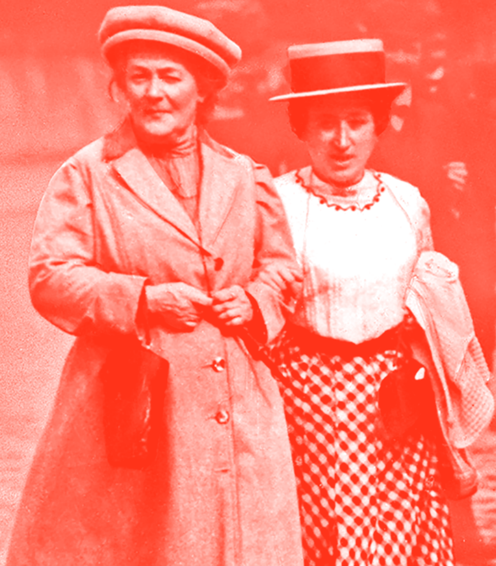
Clara Zetkin y Rosa Luxemburgo 1910