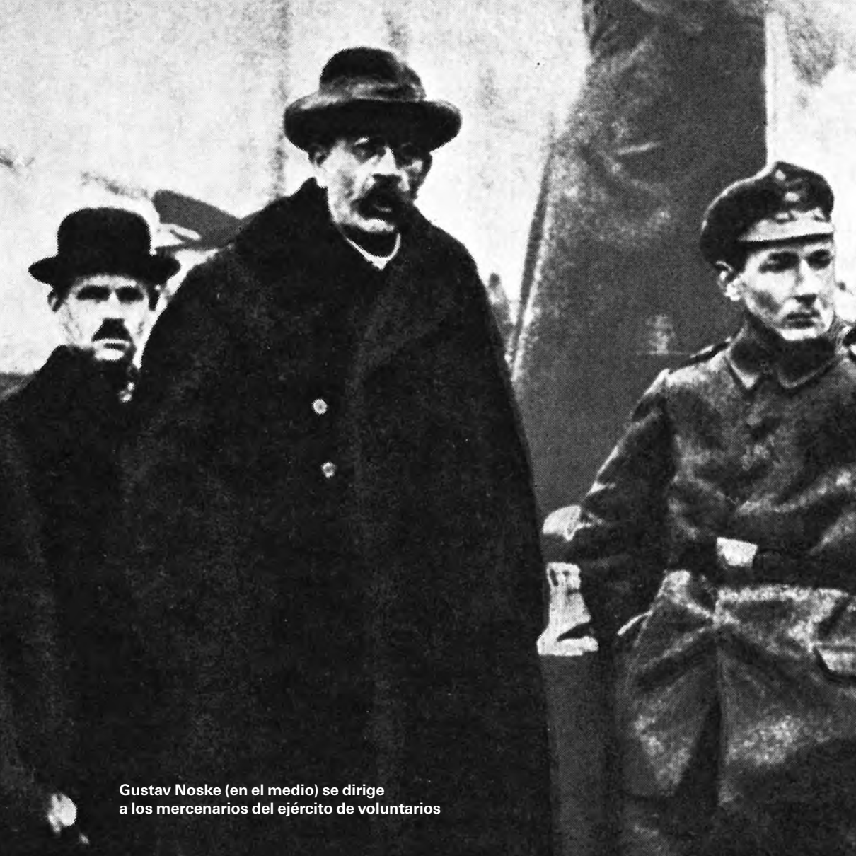
Gustav Noske (en el medio) se dirige a los mercenarios del ejército de voluntarios