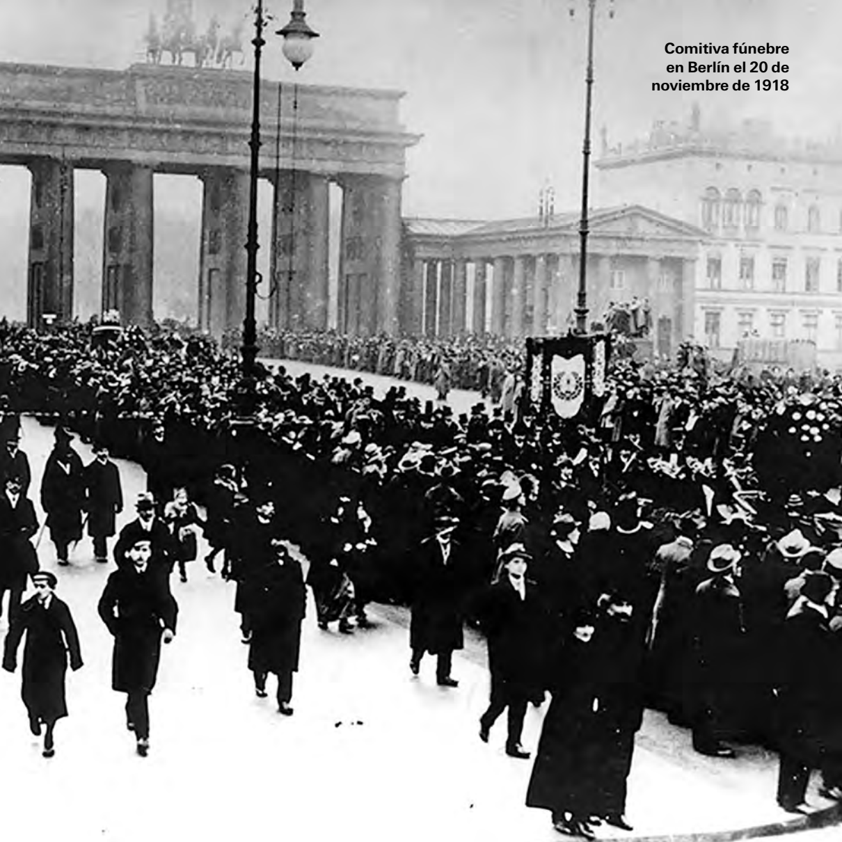
Comitiva fúnebre en Berlín el 20 de noviembre de 1918