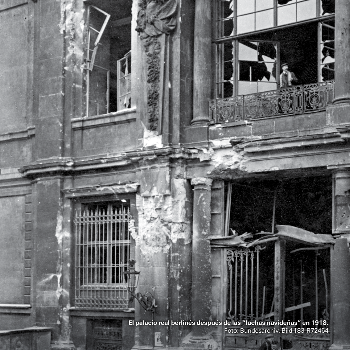
El palacio real berlinés después de las "luchas navideñas" en 1918.