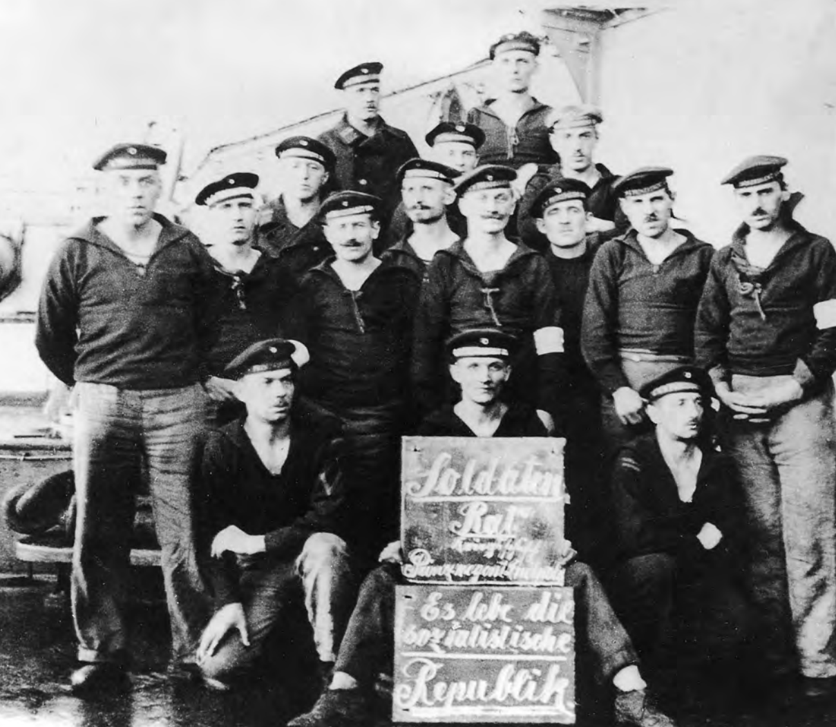
Marineros del buque de línea "Prinzregent Luitpold" con un tablero " Consejo de soldados del buque de guerra "Prinzregent Luitpold" "Viva la república socialista"