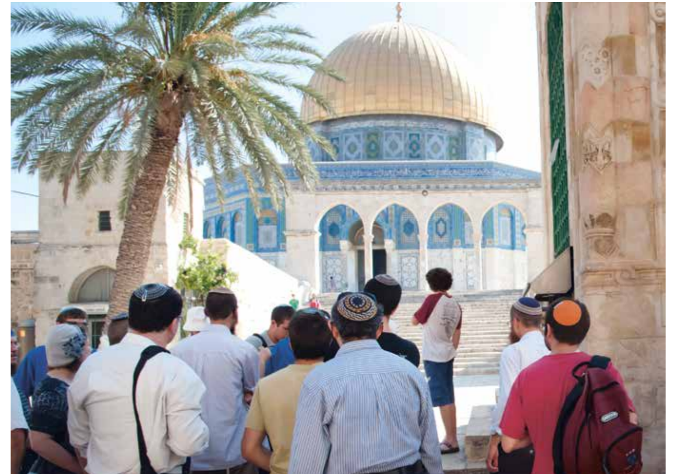
Teilnehmer einer Tour für orthodoxe Juden auf den Tempelberg, 2011.