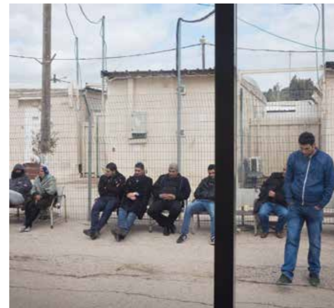
Palästinensische Bauern in Deir al-Ghusun fordern freien Zugang zu ihren Feldern, 2017.